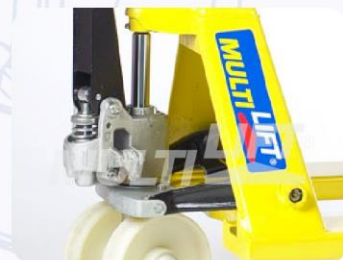
Bomba hidráulica de una sola pieza, que maximiza eficiencia y productividad.