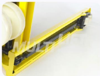
Construcción ultra reforzada.