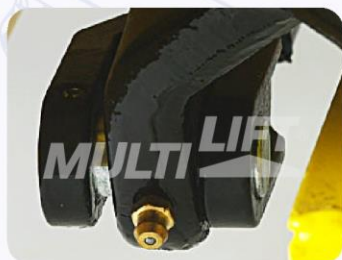
Graseras de lubricación en puntos clave.