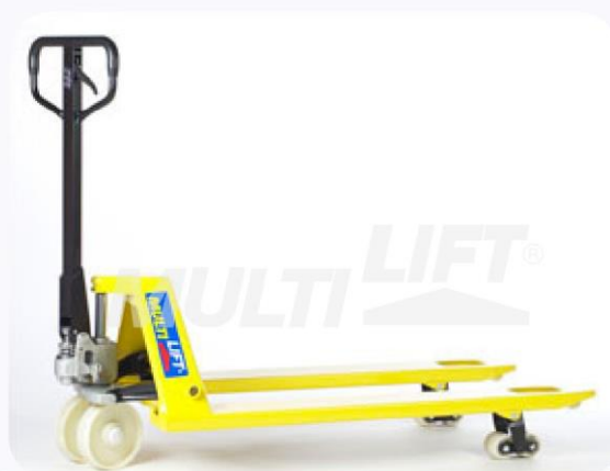
Estructura de Acero con ruedas delanteras y traseras de nylamid.