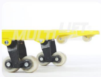
Ruedas de Nylamid tipo tándem.