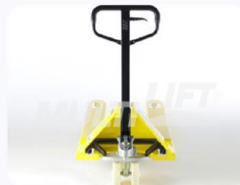
Maneral de operación con manija de 3 posiciones.